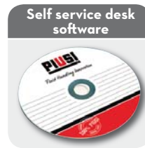
Self service desk software