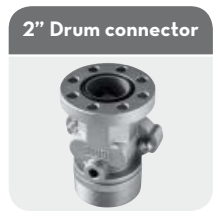
2" Drum connector