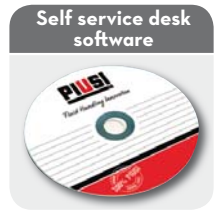
Self service desk software