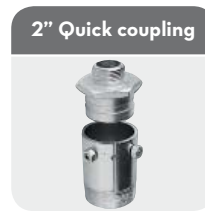
2" Quick coupling