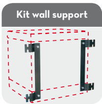
Kit wall support