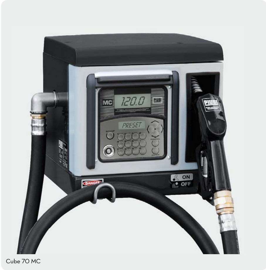
Cube 70 MC